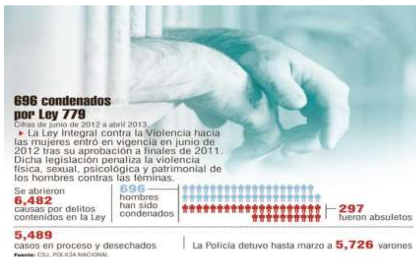
Ilustración 2: Informe de procesado por la ley 779

Esto podría deberse al hecho de que este departamento es uno de los más productivos a nivel nacional: desde hace ya varios años, se viene explotando las bellezas geográficas de este departamento al punto de convertirse en uno de los principales destinos turísticos del país. Aunque es difícil conocer con exactitud los datos oficiales sobre la actividad turística en Rivas, se reconoce que en los últimos años ha habido un auge del turismo. Por ejemplo, no se conoce cuánto de los turistas que ingresan al país, viajan a Rivas como destino turístico. Asimismo, no existen datos desagregados sobre el gasto del total de turistas a nivel departamental y municipal, entre otros. Sin embargo, algunos datos proporcionados de manera irregular pueden darnos una idea del decrecimiento de la actividad turística en Rivas por las últimas situaciones sociopolíticas.