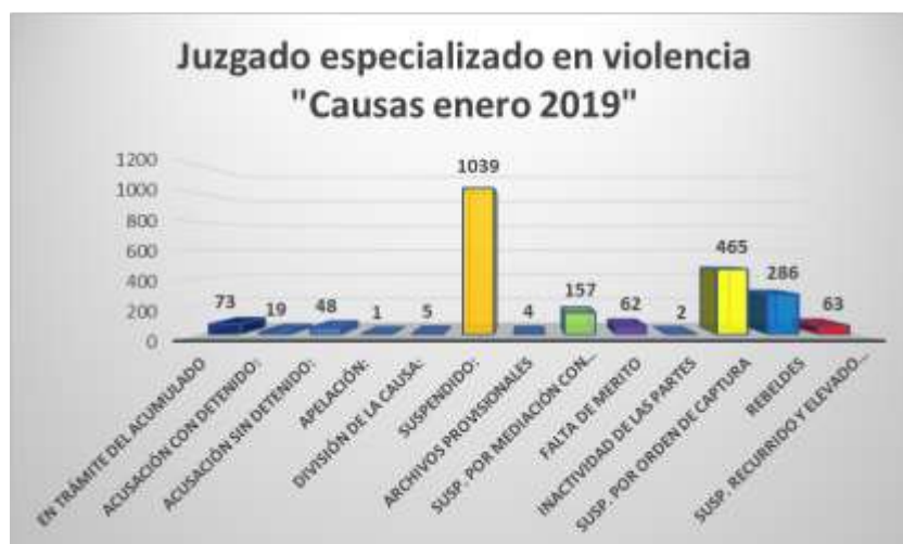
Gráfica 3: Incidencias delictivas en enero 2019