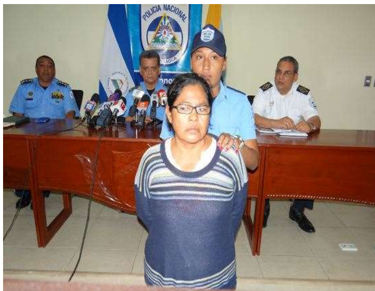
Ilustración 3: El tráfico de migrantes detonante de la delincuencia organizada.