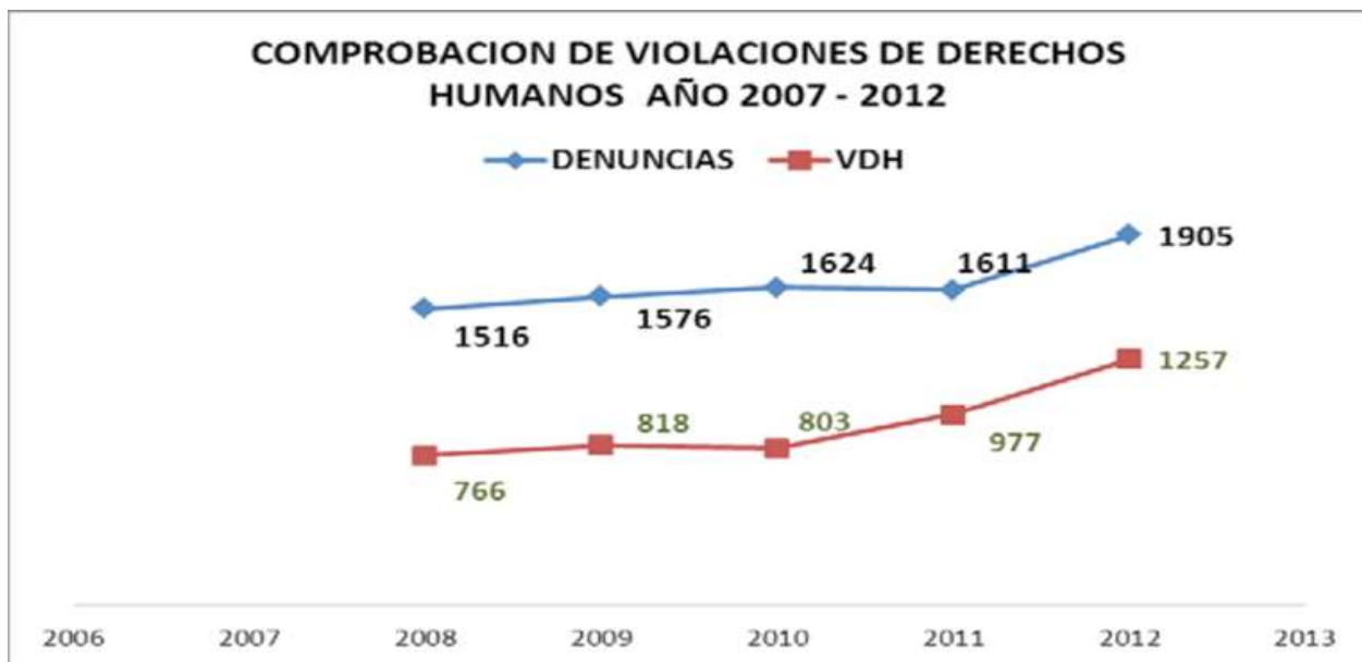
Gráfica 4: Comprobación de violaciones de derechos humanos