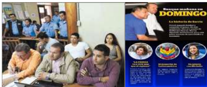
Gráfica 2: Juicios de relevancia nacional en el que la defensa fue el autor de esta tesis.

Hago notar que distintos periódicos de circulación del país les dieron cobertura a las causas que este autor de la tesis defendía con el único propósito de tener acceso en su totalidad con los acusados o judicializados, y así poder obtener de ellos la mayor participación relacionada con el tema de investigación, del cual hago alusión que las teorías de esta investigación fueron de gran aporte para la adecuada condena de los procesados.