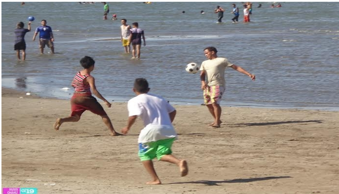
Veraneantes se divierten jugando futbol de playa en las zonas costeras de Masachapa.