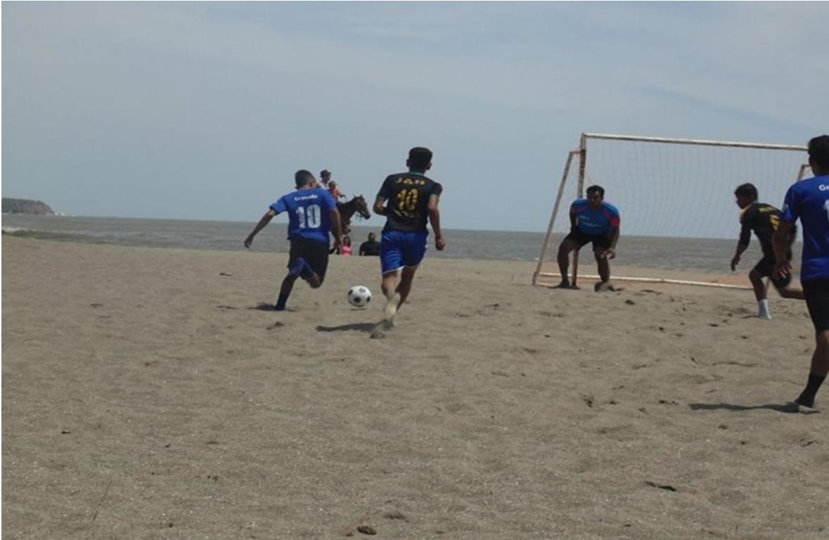
Juego amistoso en las Playas de Pochomil.