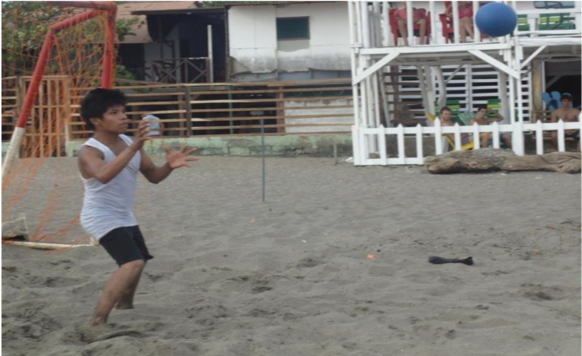
Preparándose previo al torneo de futbol de Playa.