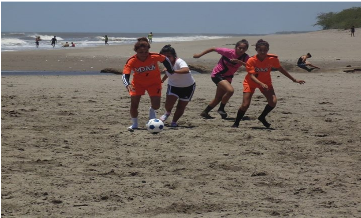
Competencia de Futbol de playa femenino en Pochomil.