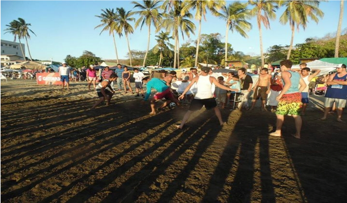
Eventos de futbol de playa en San Juan del Sur.