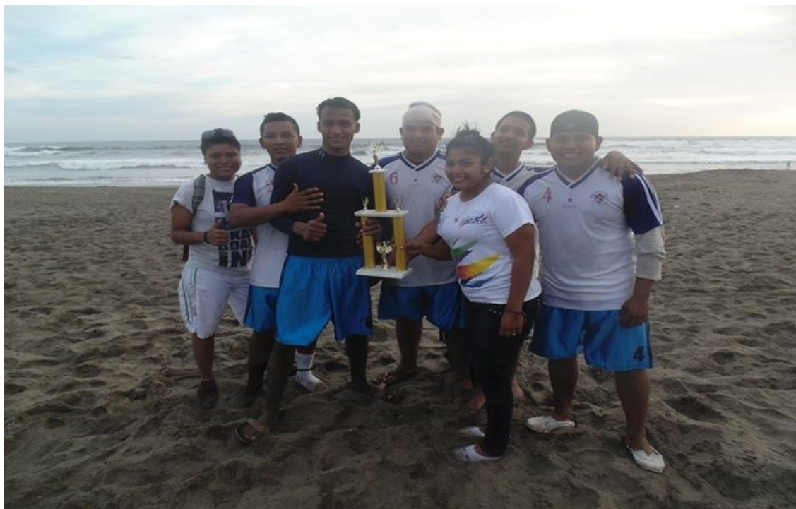
Los campeones de Masachapa