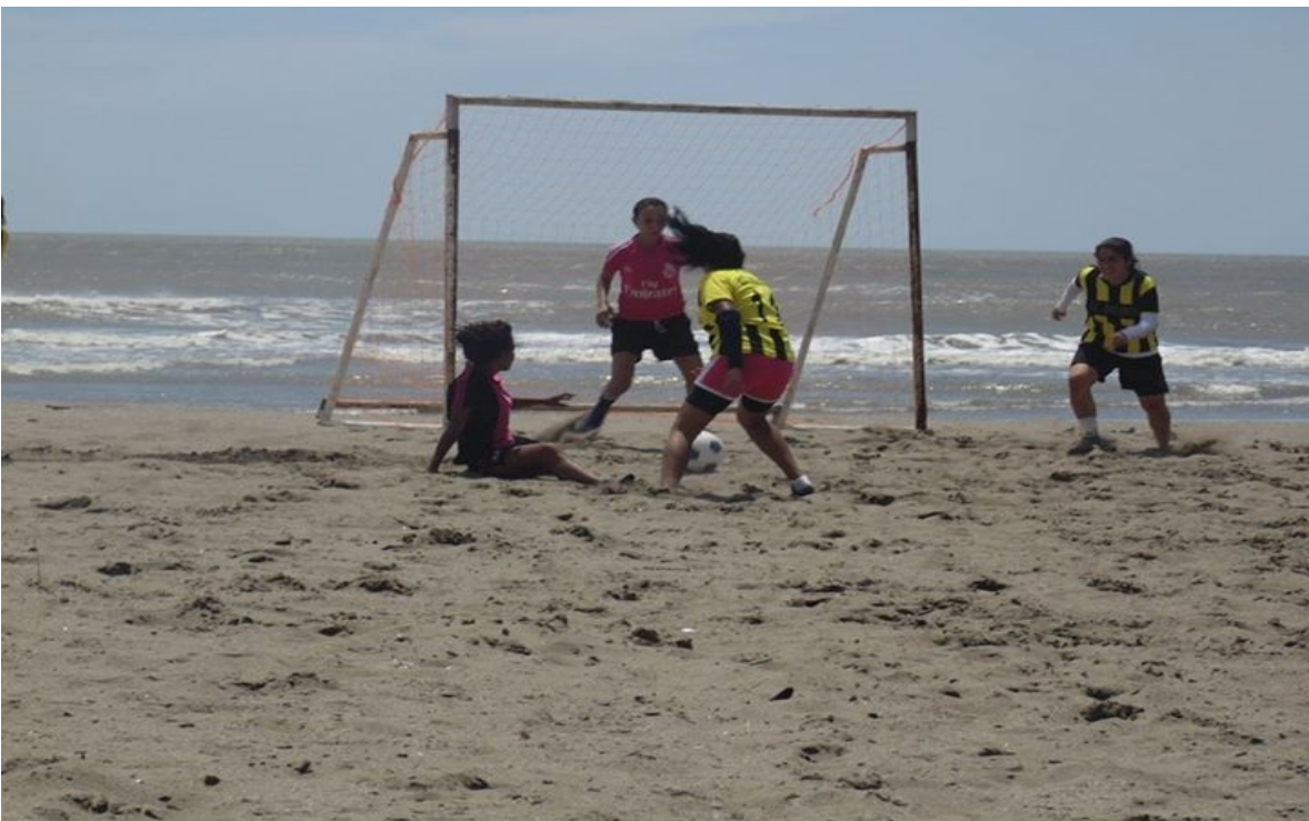
Juegos femeninos en las playas de Masachapa