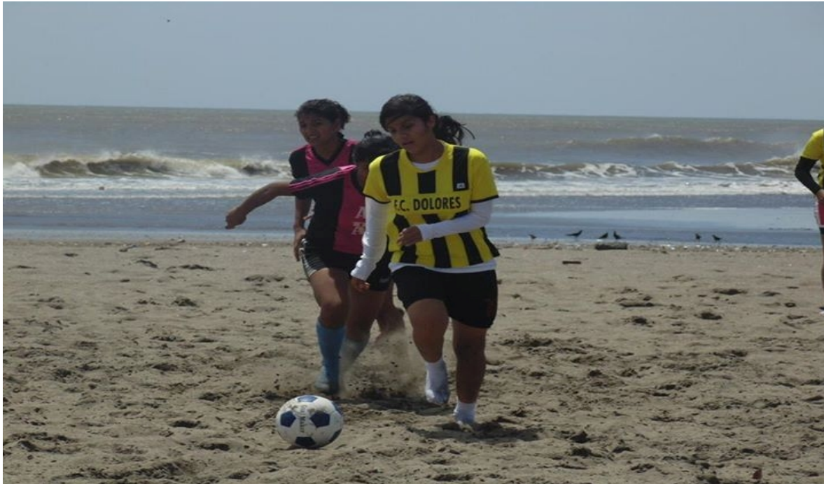
Equipo de fútbol de playa femenino del departamento de Carazo