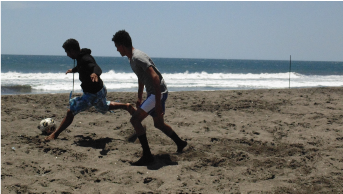
Juego amistoso y de práctica en la Playa de Poneloya.