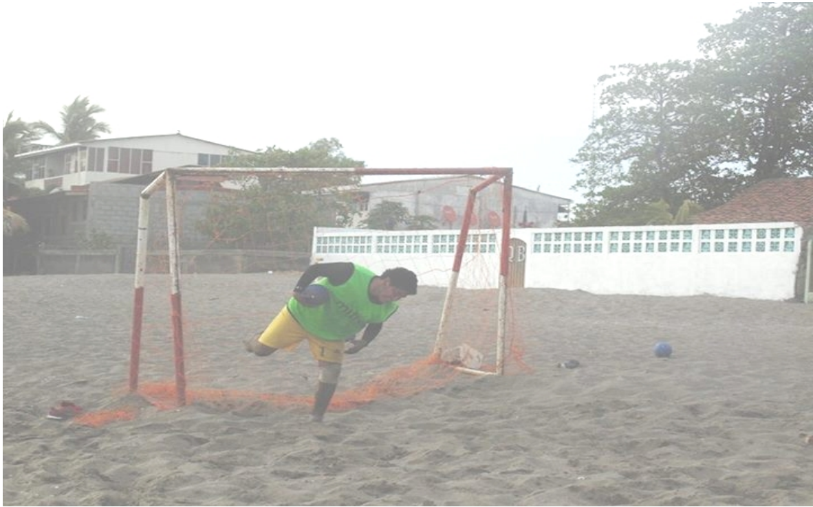
Entrenando al portero de futbol de playa en Huehuete.