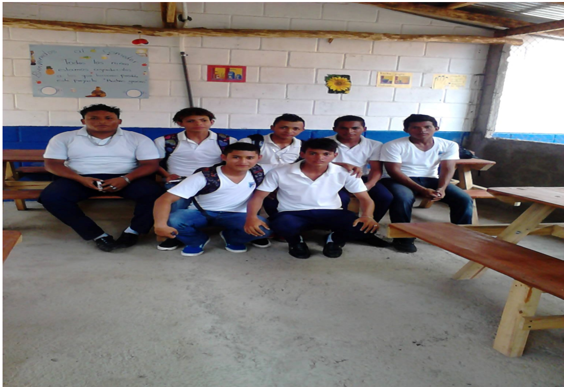
Estudiantes del Colegio San Benito de Palermo algunos de los jugadores que integran los equipos de futbol playa en PoneLOYA.