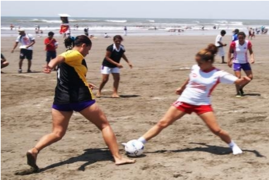
Equipo femenino en torneo de futbol de playa en semana santa.