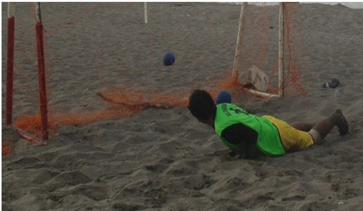
Entrenamiento del Guardamete en las Playas de Huehuete.