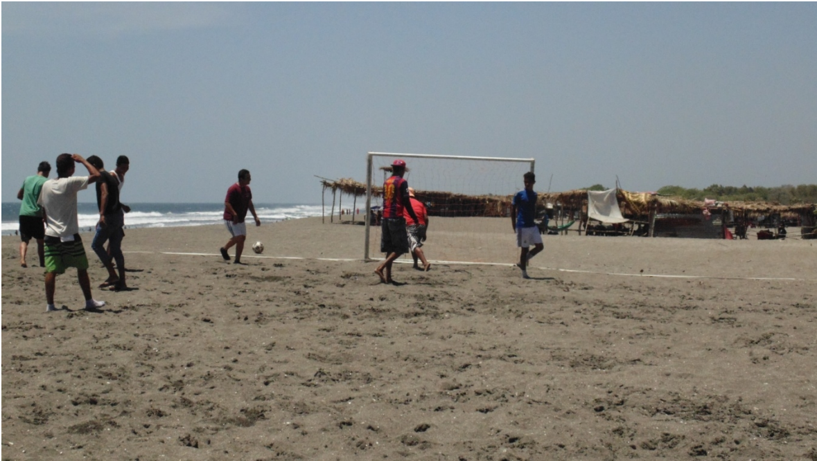
Juegos competitivos de playa en Masachapa