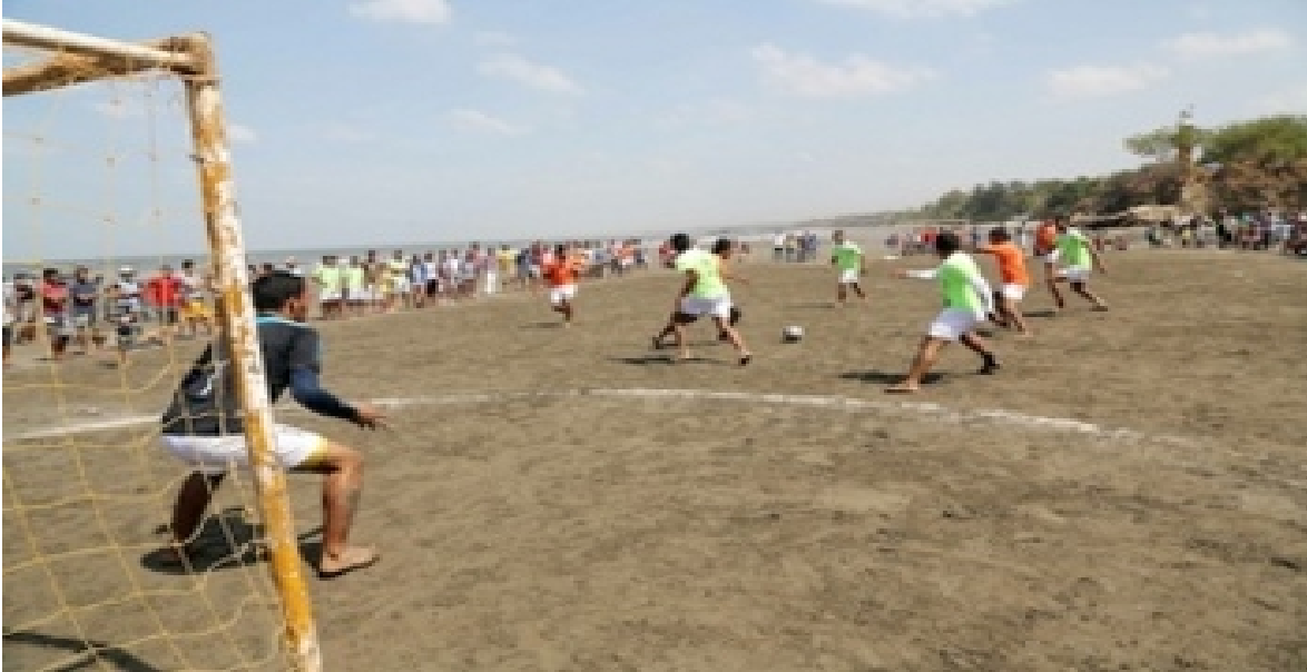
Torneo de futbol de playa en Masachapa, verano 2011.