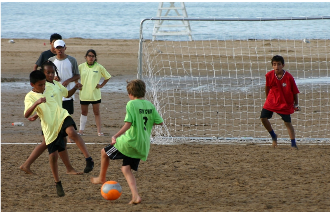
Niños jugando futbol de playa en Pochomil.