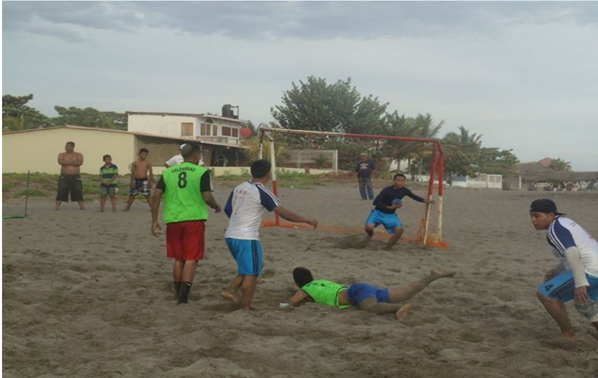
Juegos de fútbol playa masculino en Masachapa