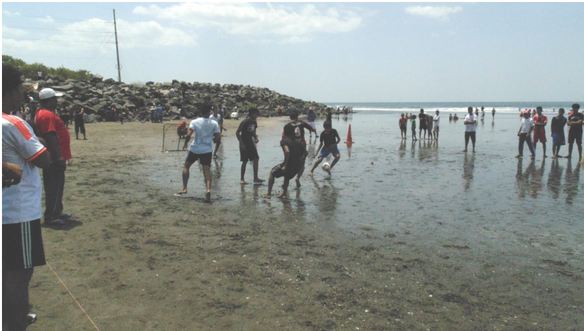
Torneo de futbol de playa en Paso Caballo.