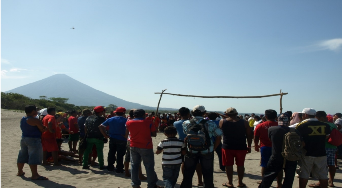
Definiendo las reglas de juego en playa Santo Domingo Isla de Ometepe.