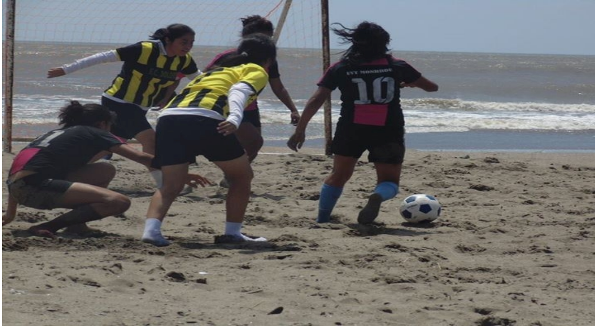
Jugando futbol de playa en Poneloya.