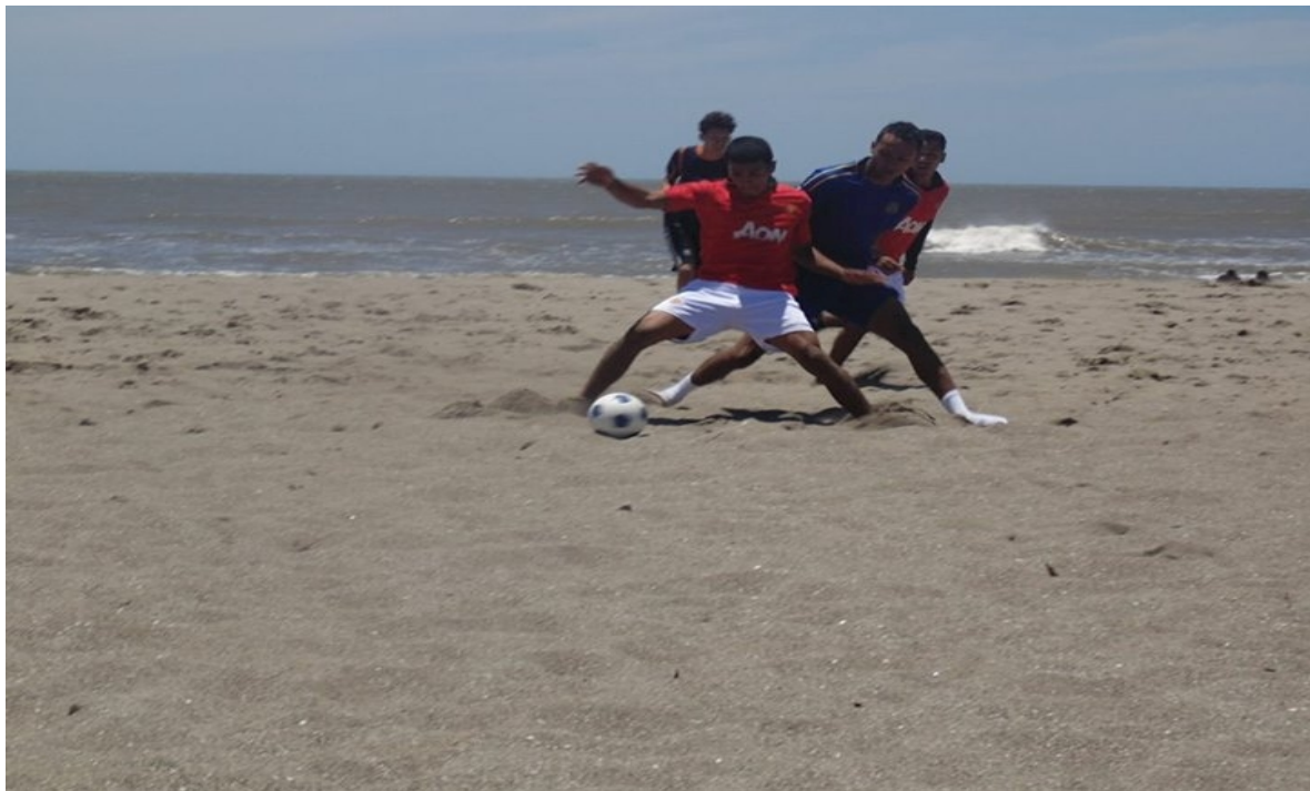
Torneo de futbol de playa en Pochomil