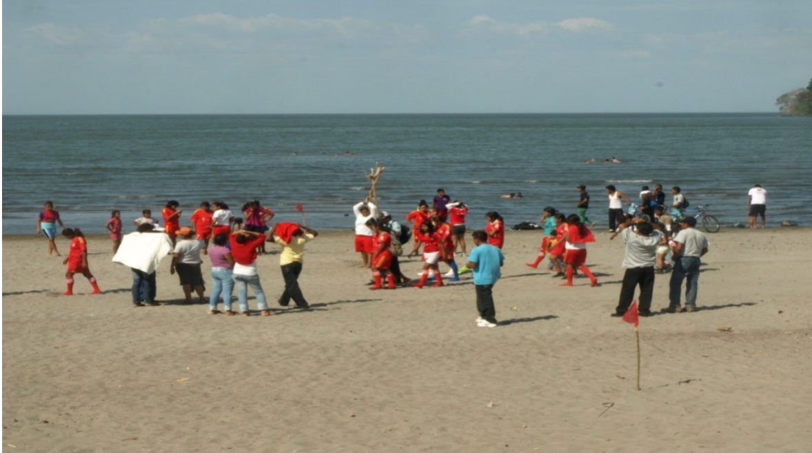
Preparándose para iniciar el juego de futbol de playa, equipo femenino en la Isla de Ometepe.