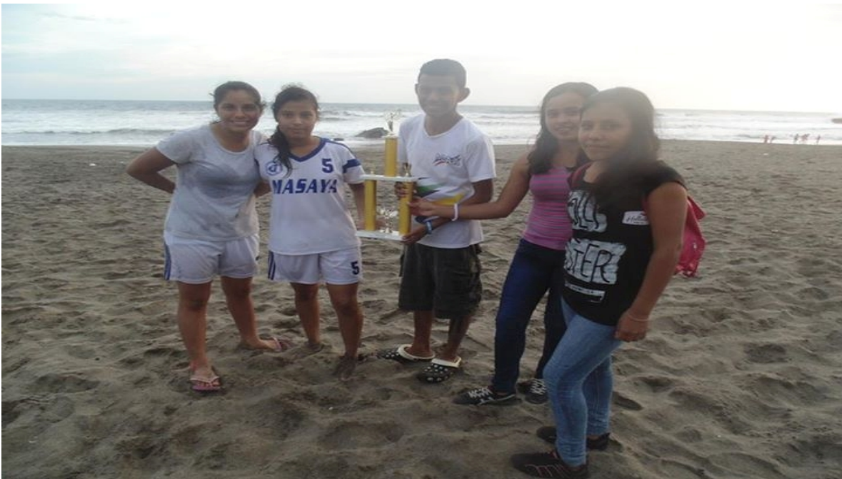
Equipo del departamento de Masaya subcampeón en el torneo de Fútbol de Playa.