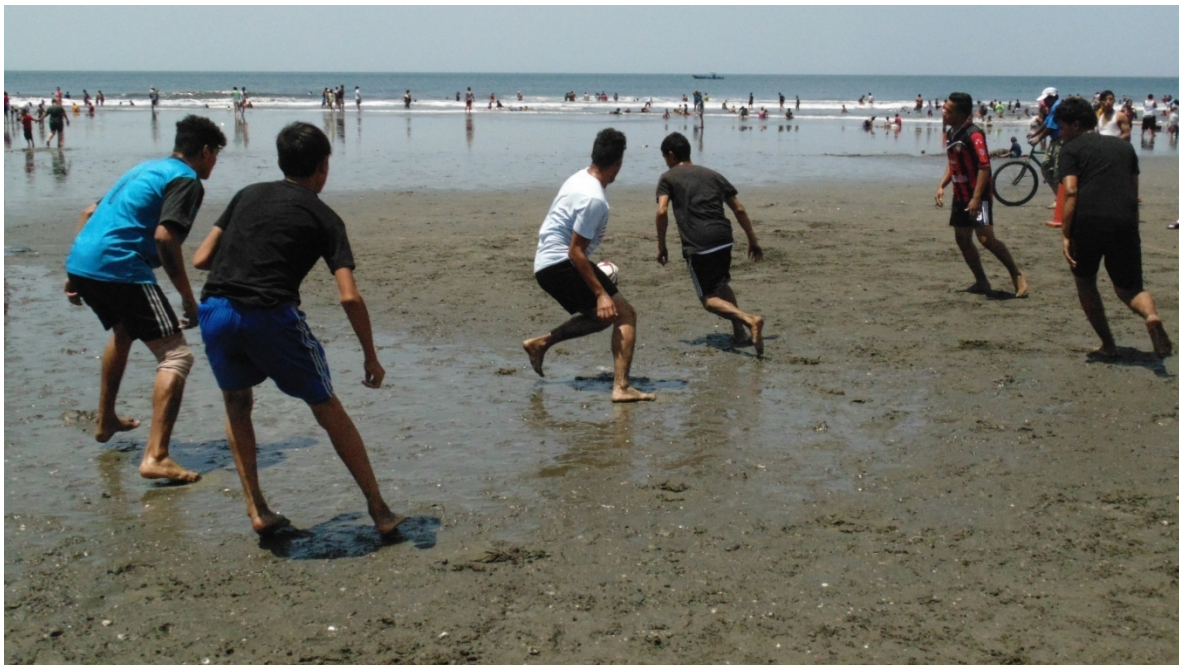
Juego amistoso y recreativo realizado por veraneantes en las Playas de Paso Caballo, en el puerto de Corinto.