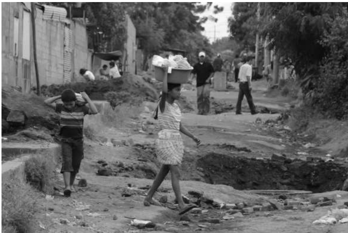
Los discursos hegemónicos sobre la pobreza esparcen en el imaginario colectivo que la importancia, valor o “peligrosidad” de las personas está asociada, íntimamente, con las condiciones materiales y el grado de urbanización de los lugares en los que se reside. En la foto, una calle del barrio Hugo Chávez en el noreste de Managua.

Por su parte, las y los estudiantes de la Escuela de Liderazgo coincidieron con las promotoras del MEC en señalar que la ausencia de oportunidades que debería generar el Estado, aunado a la corrupción y la falta de democracia que se ha vivido históricamente en el país, resultan ser los principales ejes que ralentizan la superación de la pobreza. Sin embargo, cuando preguntamos el papel del pobre en la construcción propia de cualquier oportunidad para la solución de la pobreza, notamos que había cierto sentir en ambos procesos de culpar al pobre.