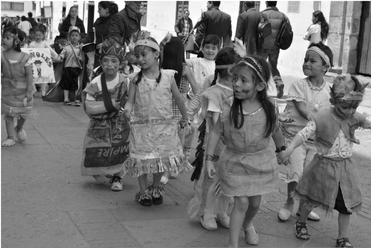
Niños y niñas en la celebración del Día de la Raza que se realiza todos los doce de octubre en las entidades de educación del país. Sin embargo, la crítica establece que se debe conmemorar el Día de la Resistencia Indígena en memoria y repudio de todas las formas de dominación colonial y neocolonial que ha experimentado América Latina.

La Tempestad, libro de William Shakespeare, ha sido uno de los textos estudiados como una alusión de la conquista y colonización de América para el pensamiento latinoamericano. En él, Próspero, un duque despojado de sus tierras por su hermano, llega a una isla cuyo dueño es Calibán, un deforme y bruto ser, al que Sycorax —bruja a la que la ínsula pertenecía- heredó sus tierras. Próspero le enseña su lengua a Calibán, se vuelve el dueño de la isla y hace de él su esclavo.