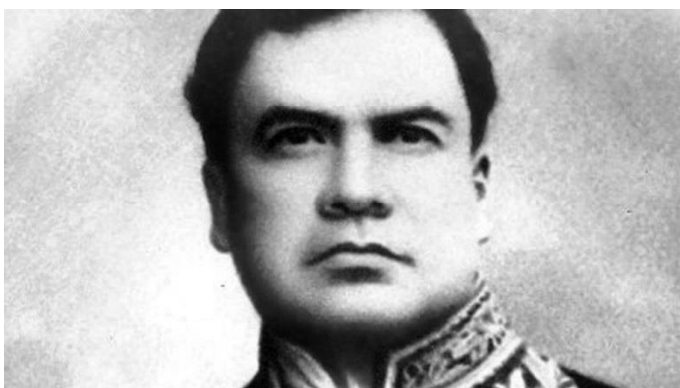
En 1898, Rubén Darío, publicó su ensayo "El triunfo del Calibán", inspirado en el personaje de "La tempestad" de William Shakespeare, http://www.lanacion.com.ar/1868703-ruben-dario-el-poeta-que-invento-la-nueva-cronica-latinoamericana

“Colorados, pesados, groseros, van por sus calles empujándose y rozándose animalmente, a la caza del dollar. El ideal de esos calibanes está circunscrito a la bolsa y a la fábrica. Comen, comen, calculan, beben whisky y hacen millones. Cantan ¡Home, sweet home! Y su hogar es una cuenta corriente, un banjo, un negro y una pipa. Enemigos de toda idealidad, son en su progreso apoplético, perpetuos espejos de aumento...” (Darío, 1898).