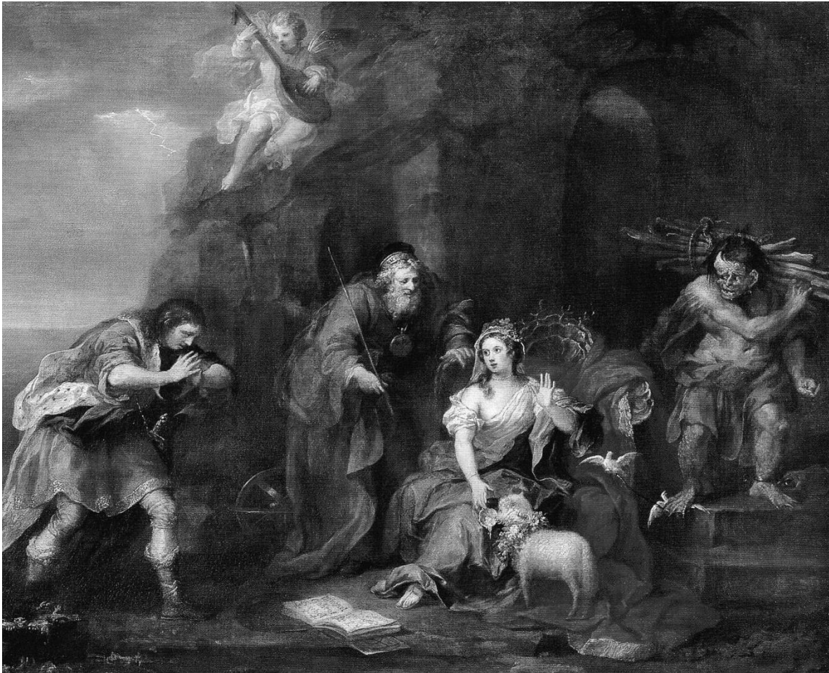
Una escena del acto I, escena 2 (Fernando Miranda cortejo) de Shakespeare "La Tempestad"

como en la vida económica de estas. Fueron ellas las que más se opusieron a la imposición de estas nuevas estructuras de poder traídas por los españoles, pues eran las más afectadas. El papel de las mujeres fue crucial para mantener las culturas indígenas latinoamericanas, sin embargo, los españoles trajeron consigo un sin número de costumbres misóginas y reestructuraron la economía y el poder político a favor de los hombres.