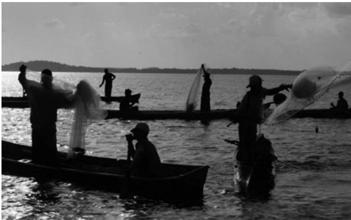
Pescadores en la Laguna de Bluefields.