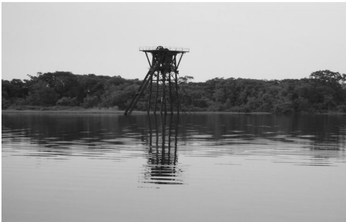
Draga utilizada a finales del siglo XIX en el Río San Juan, por Estados Unidos, al realizar algunas obras para estudiar la viabilidad del Canal Interoceánico. / María Luisa Acosta

ERM ha otorgado al Proyecto la categoría “A”, por los impactos sociales y ambientales adversos, significativos que de éste se puedan derivar y que podrán ser diversos, irreversibles o sin precedentes. 7