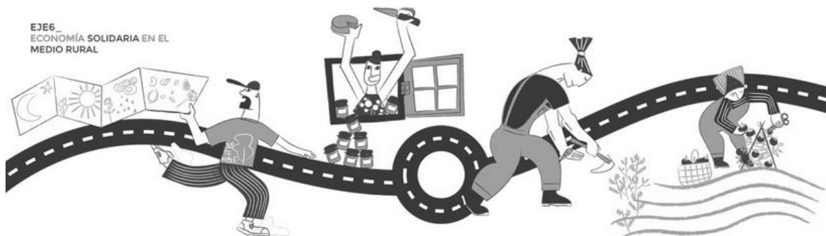
Uno de los flyer del I Congreso Internacional de Economía Social Solidaria celebrado en Zaragoza, España / elsalmoncontracorriente.es

A continuación, de forma puntual, se establecerán los elementos de la Constitución económica del NCL que podrían ser utilizados como referentes jurídicos actuales para eventuales procesos constituyentes en Centroamérica.