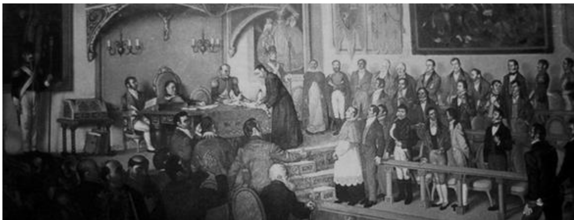
Firma del Acta de Independencia de Centroamérica

Código orgánico de planificación y finanzas públicas, de 22 de octubre de 2010 y el artículo 290.3 de la CRE de 2009, en donde se expresa que “con endeudamiento público se financiarán exclusivamente programas y proyectos de inversión para infraestructura, o que tengan capacidad financiera de pago. Sólo se podrá refinanciar deuda pública externa, siempre que las nuevas condiciones sean más beneficiosas para el Ecuador.”