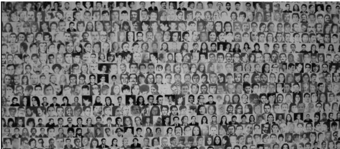
Durante la última dictadura militar en Argentina la tortura y desaparición forzada fue parte del plan sistemático represivo del Estado